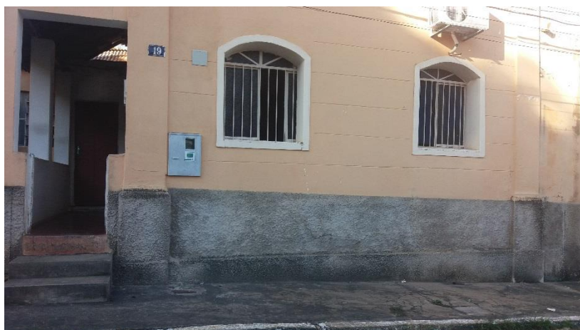
Figura 1. Registro fotográfico da visita.

No dia 08/06/2017, equipe técnica da empresa Synergia, enviou SMS para os números declarados pelo manifestante, com o objetivo que a família entre em contato com a empresa para realização do Cadastro Integrado.